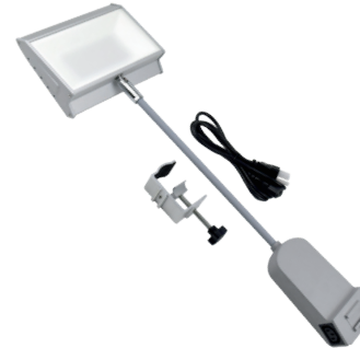
LED-Auslegestrahler LED spotlights 20W/230V-4000K, LED, silber € 49,00