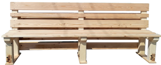
Holz-Sitzbank mit Rückwand wooden bench with back rest € 58,00