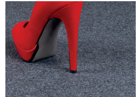
Nadelfilzteppich + PE-Folie dunkelgrau Inkl. Verlegung, Wiederaufnahme & Recycling // Needle-punch carpet + dark grey PE foil, incl. installation, removal & recycling € 11,00 / m 2

Grafiken und Digitaldrucke auf Anfrage Zusätzliche Montageleistungen € 75,00 pro Stunde Extrawünsche sind bis spätestens 6. August zu bestellen. Graphics and digital prints on request Additional assembly services € 75.00 per hour Special requests must be ordered by August 6th at the latest.