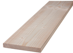
Ablagebrett zum Einhängen hanging shelf (100x20cm) € 15,00