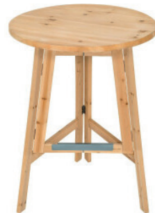
Holz-Stehtisch wooden bar table 150 cm Höhe, klappbar // foldable € 49,00