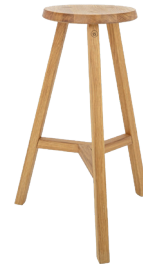
Holz-Hocker wooden stool 65cm Höhe, klappbar // foldable € 38,00