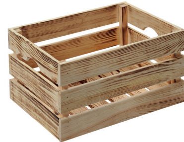
Deko-Kiste zum Einhängen // box for hanging (46x31x25cm) € 29,00